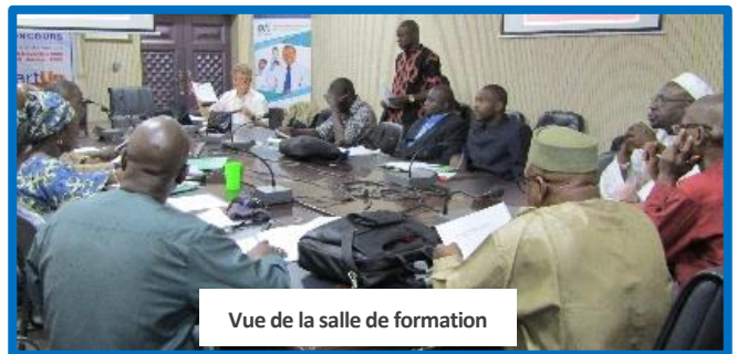
Vue de la salle de formation

Le projet assure la formation du staff concerné des AE/CAP des régions SIRA aux techniques d'évaluation des compétences fondamentales des élèves en lecture-écriture avec EGRA : « Programme de Renforcement des Capacités en EGRA » (PRCE). Le PRCE a commencé en 2017-2018 dans les AE/CAP de San et Ségou. En 2019, les AE/CAP de San et Ségou continueront avec le programme, et de 2019 à 2020, les AE/CAP de Sikasso, Koulikoro, Bamako et les personnels du MEN de Bamako suivront la formation.