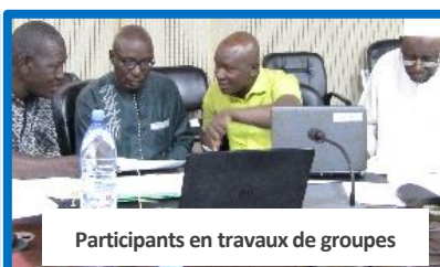
Participants en travaux de groupes